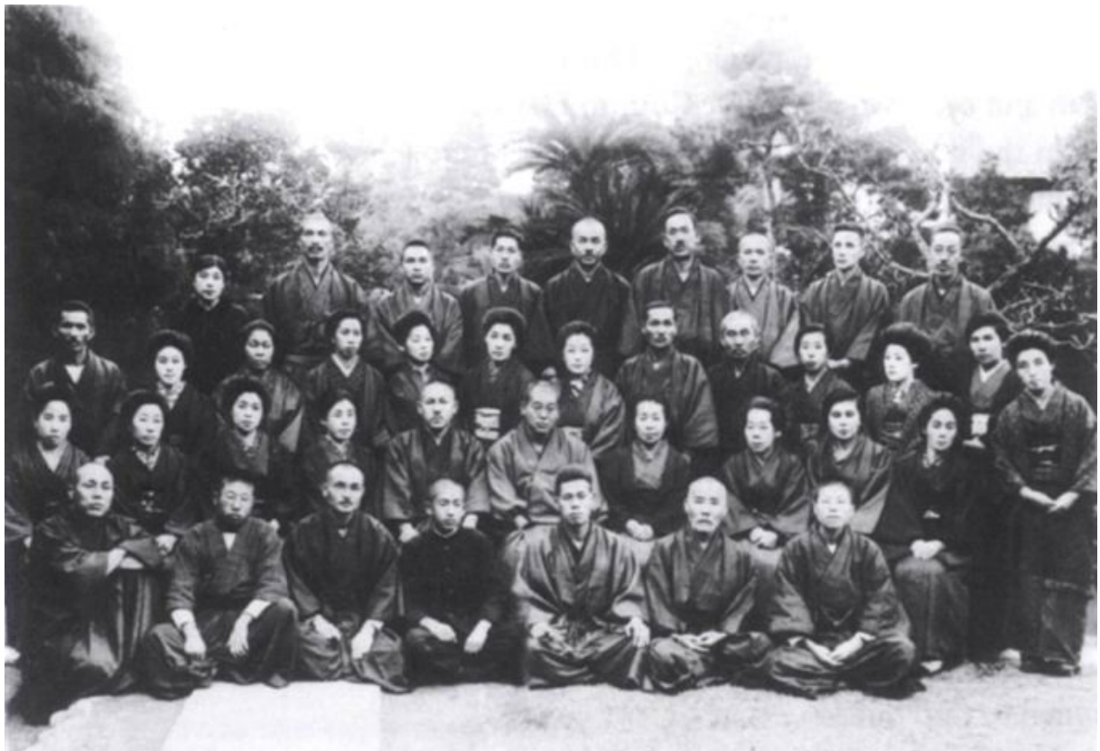
Mikao Usui - sixième à partir de la gauche, 2ème rangée.

Le Reiki n'est ni une croyance, ni une religion; c'est une technique utilisable par tous.