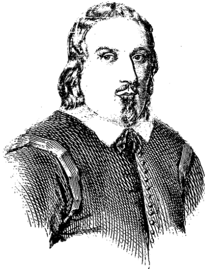
Jacob Boehme le Théosophe.